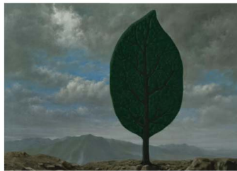
'La plaine de l'air' van René Magritte.